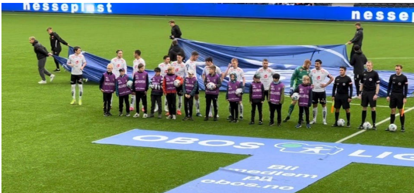
(G2013 var ballehtarar når A-laget til Sogndal møtte Åsane på Fosshaugane Campus)

Vi hadde ein flott avslutning av sesongen på Villmarka der Siv Ingeborg Melås varta opp med pizza, og gutane fekk testa grenser under Mesternes Mester med øvingar som 90-graderen