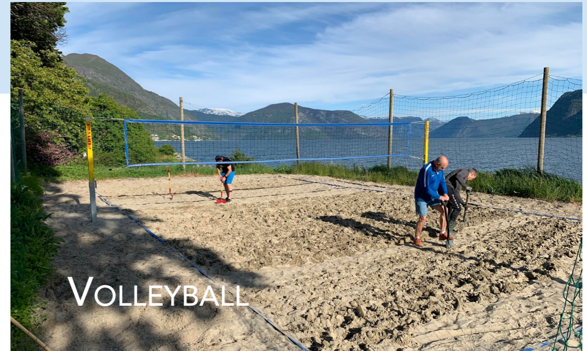
Dugnad på sandvolleyballbanen

PÅ DEI NESTE SIDENE FINN DU ALLE ÅRSMELDINGANE FOR DEI ULIKE SÆRGRUPPENE, SAMT LITT ØKONOMI TIL SLUTT. GOD LESING VIDARE!