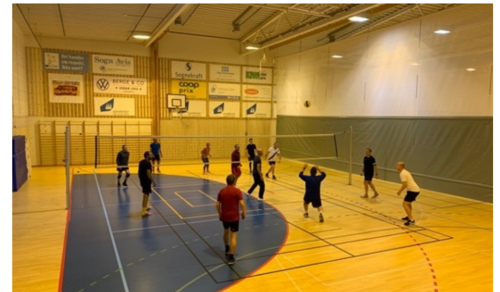
Trening i Saften, høst 2022