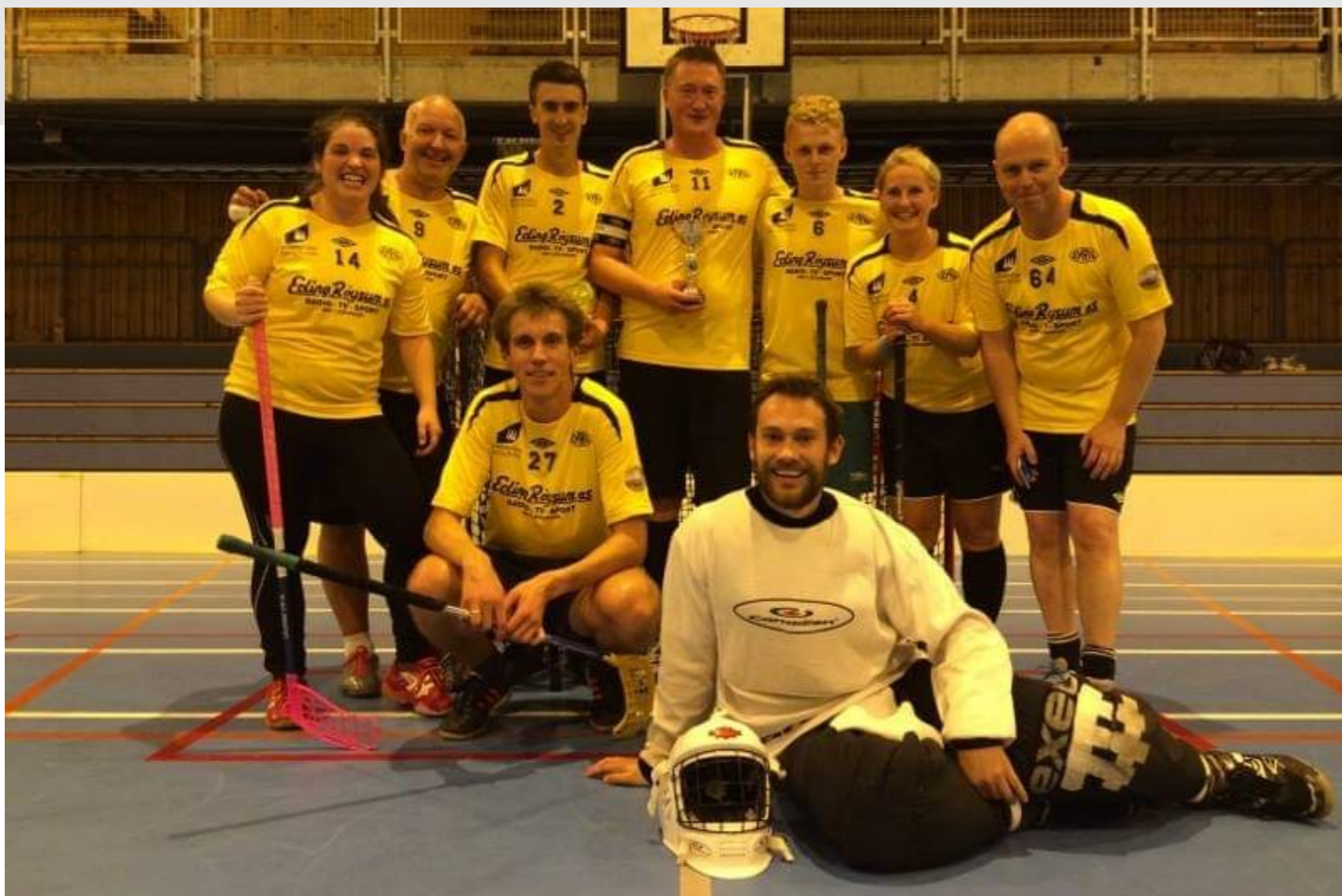
Mimrebilde frå bandyturnering i Førde, 2014