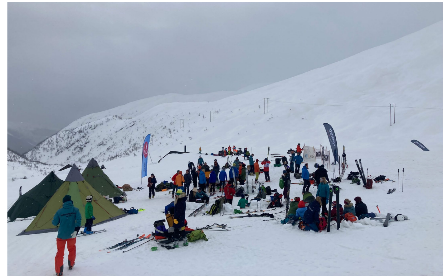
Bilde frå Sognefjordrennet 2022