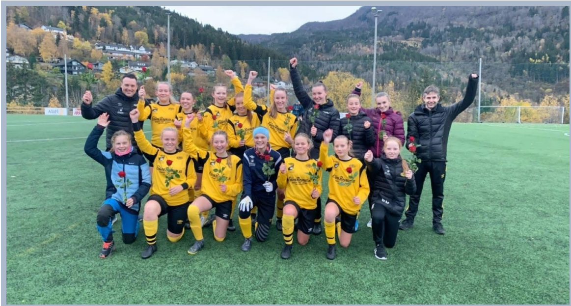
KM vinnarar J15/17 9ar

Takk også til foreldre som har stilt opp på foreldreoppgåver de vart tildelt.