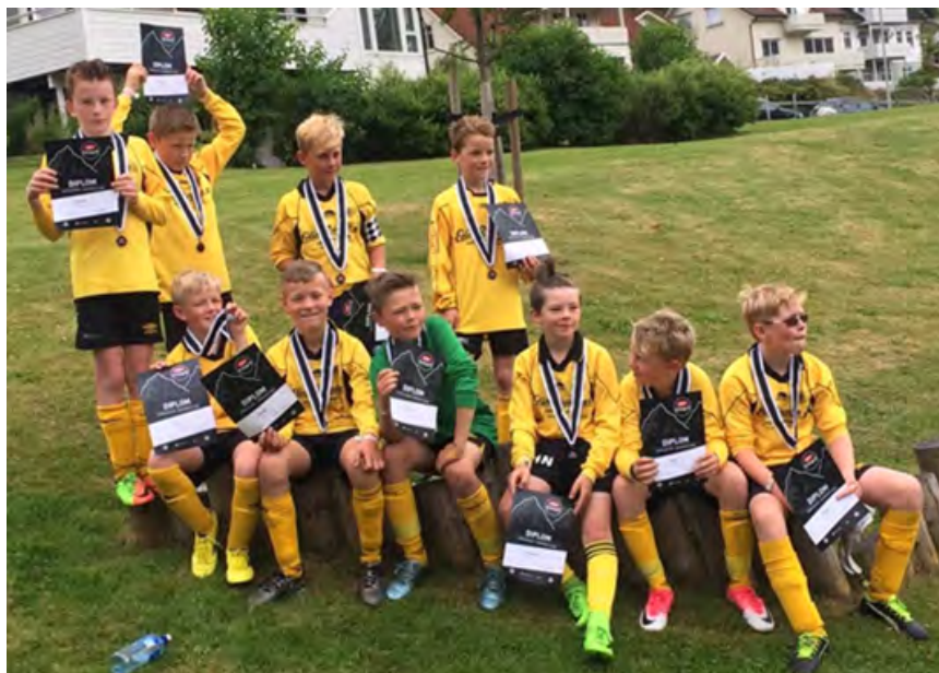
Ein fornøgd gjeng på Lerum Cup