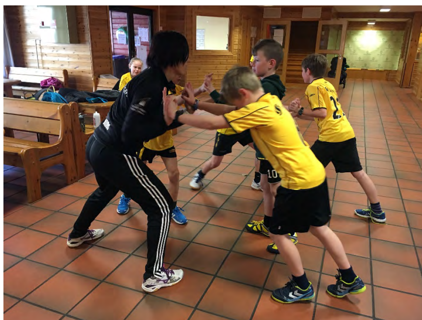
Turnering i Gaupne, «oppvarming»