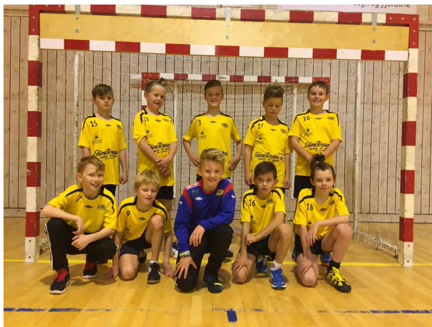
Lagbilde G10, frå turneringa i Saften